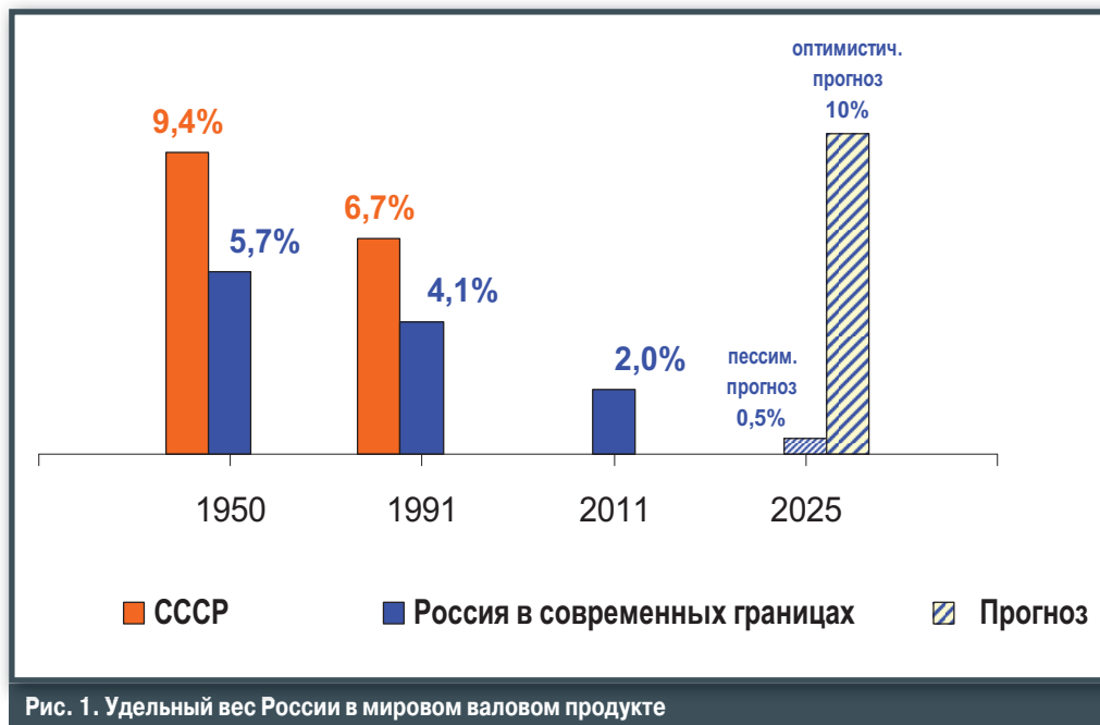
Рис. 1. Удельный вес России в мировом валовом продукте

Безусловно, эти факты свидетельствуют о важности продолжения работ по совершенствованию системы контроля, системы управления организациями. Кроме того, о необходимости проведения работ по контролю деятельности организаций, выполняющих работы на объектах капитального строительства, свидетельствуют, например, данные Мосгорстройнадзора, который в 2011 г. проверил 24,9 тыс. строек и выявил 83,9 тыс. нарушений. Каждый второй объект стройкомплекса работает с нарушениями, выдано 21,3 тыс. предписаний, общая сумма штрафа составила 93 млн руб.